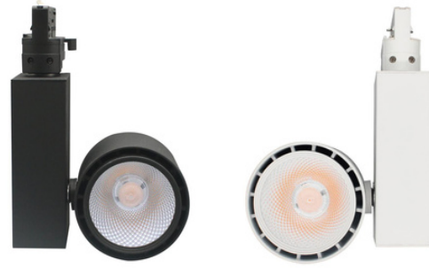
Hoch Qualitativer Reflektor und Linse