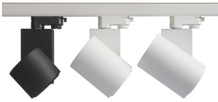
15W 20W/ 30W/ 40W