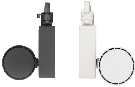
Aluminium Rückseite und Treiber Verkleidung