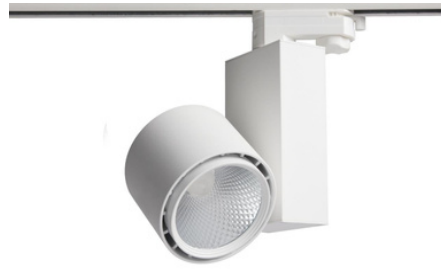
TLE 15W 20W